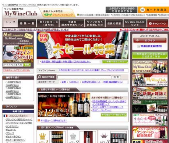
【マイワインクラブのトップページ】