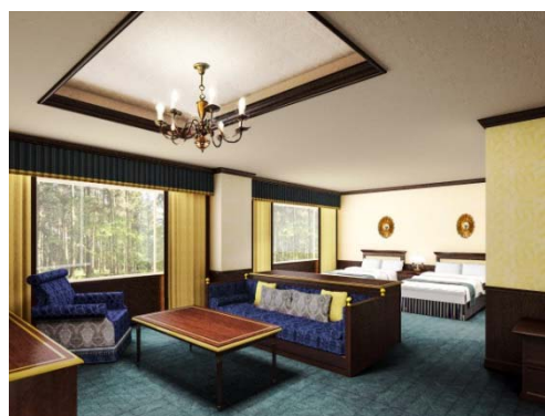
スイートルーム イメージ

裏磐梯は、福島県北部にある磐梯山、安達太良山、吾妻山に囲まれた高原で、山や森、湖など自然に恵まれたエリアです。春は桜や新緑、夏は避暑地、秋は紅葉、冬はスノーリゾートと、季節ごとに多くのアクティビティを楽しめます。「裏磐梯レイクリゾート」は、桧原湖や五色沼に隣接する場所にあるリゾートホテルで、ホテル内には自噴する保湿効果高い天然温泉があり、湖を眺めながら入れる露天風呂や展望ラウンジなど、随所で大自然を体感できます。