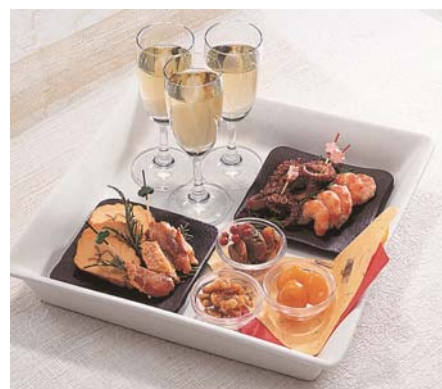
盛り付けのアレンジ例（写真はイメージです）

今後もベルーナは、“お客様の衣食住遊を豊かにする商品やサービスを提供する”という経営理念の下、お客様のニーズに応えた商品を提供し続けてまいります。