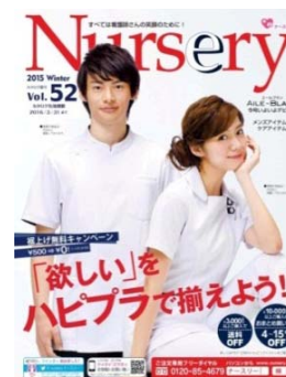
<ナースリーVol. 52 冬号>