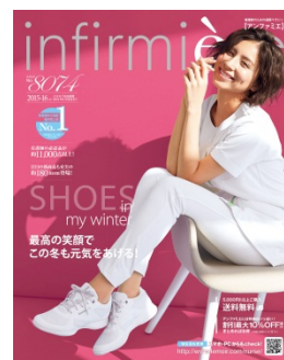
<アンファミエ 2015 冬>