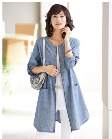
<綿麻素材ジッパー使いチュニックワンピース>

気象庁の長期予報では、夏の平均気温は、東日本で平年並または高くなる確率がともに40%、西日本で高くなる確率が50%、沖縄・奄美で高くなる確率が60%となっており、今年も厳しい暑さが見込まれます。