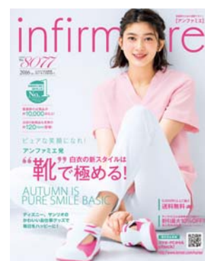
<アンファミエ 2016 秋>