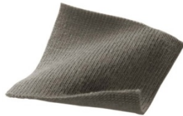
<程よい厚みのある素材>