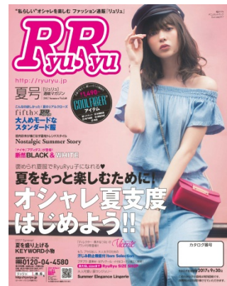
<RyuRyu 2017 夏号>