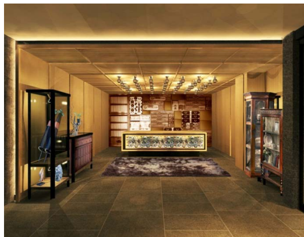
<京都グランベルホテル フロント>

京都への観光客数は年々増加しており、2015年は観光客数が5,684万人、宿泊客数は1,362万人とともに過去最高を記録しております。また外国人宿泊客数も前年より72.8%増と大幅に増加し、日本の訪日外客数の伸び率47.2%を上回るほど、京都のインバウンド需要は高まっています。(※「京都観光総合調査2015年」より)