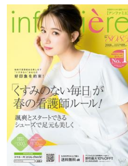
<アンファミエ 春号>