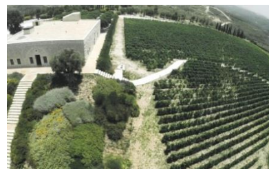
<生産地 ベッカー高原>