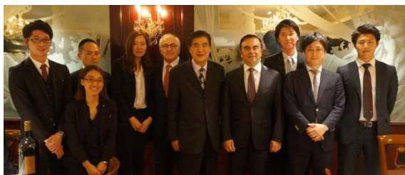
< My Wine CLUB のメンバーと集合写真 >