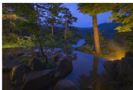
<源泉 100%かけ流しの絶景露天温泉>