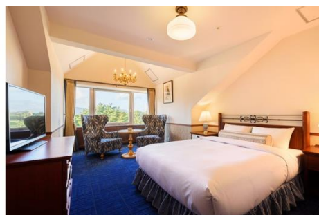
<ペントハウスデラックスダブル(34㎡)>