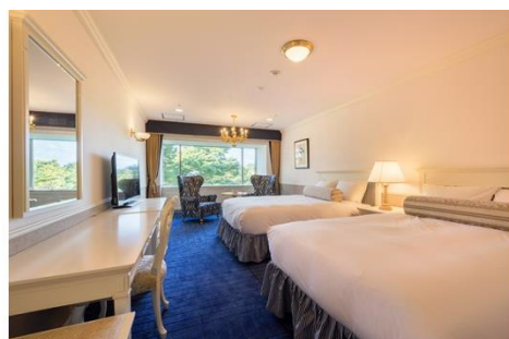
<スーペリアツイン(41㎡)>