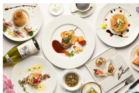
<夕食: カジュアルフレンチ>