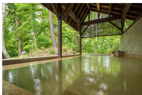
<迎賓館猫魔離宮専用「虹の森温泉」>