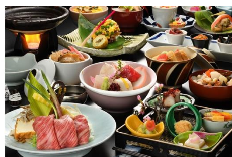
<夕食: 季節の和会席>