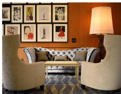
<アートを堪能出来るロビー>