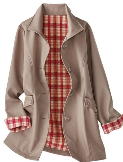
<裏はあったかフリース仕様>

“寒くなってきて羽織りたいけど着膨れしちゃう”そんな悩みを解決するのが「あったか裏フリース！優秀素材の大活躍コート」です。裏はフリース素材で暖かく、表はさらりとした肌ざわりでスッキリと着こなせます。洗練されたベーシックなデザインなのでどんなシーンにも合わせられます。