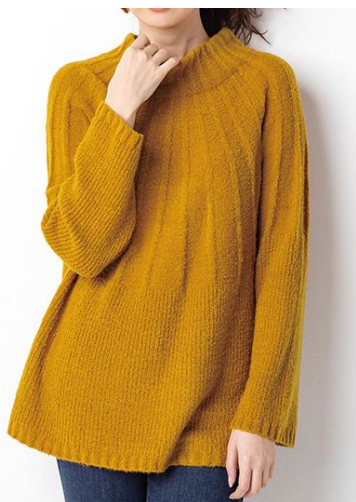
ふんわり素材編柄ニット

https://belluna.jp/01/010101/d/OCYQ/00005/goods_detail/