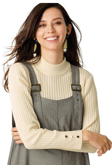
ハイネックワイドリブニット

https://belluna.jp/01/010101/d/OCYQ/00004/goods_detail/