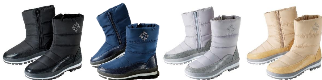
<黒、ネイビー、グレー、ベージュ>