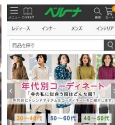
カテゴリから探す <スマホサイト>