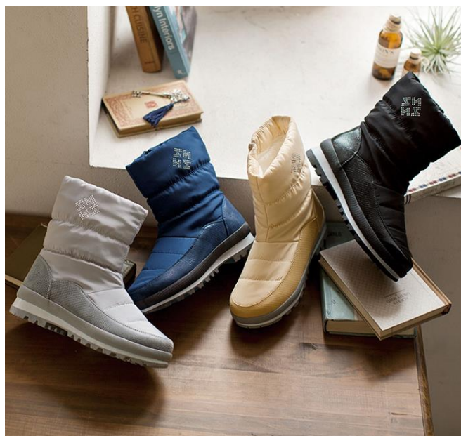
<4Eはっ水ウィンターブーツ> 2,990円（税別）

株式会社ベルーナ（本社：埼玉県上尾市／代表：安野 清）が展開する大人の女性向け通販ブランド「BELLUNA（ベルーナ）」（ https://belluna.jp/ ）は秋冬号にて「4Eはっ水ウィンターブーツ」を発売しました。