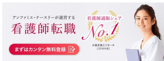
<ナースキャリアネクスト サイト>