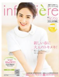
<アンファミエ春号>