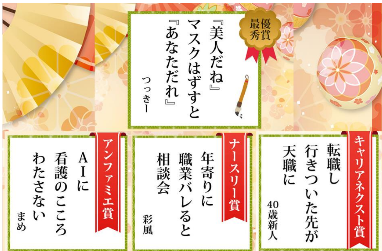
<第4回 「ナース川柳」受賞作品>