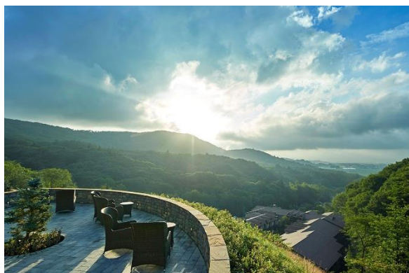
<山の上スイートテラス>

「ルグラン軽井沢ホテル&リゾート」は、2018年に自然豊かな南軽井沢の地に誕生しました。7万坪の広大な敷地内に、ホテル・ヴィラ・温泉棟や庭園が点在する滞在型リゾートです。標高 1,000mのテラスからは、軽井沢の浅間山の絶景を一望でき、夕食はミシュラン 1 つ星シェフによる美食フレンチをご用意。クラシック調の館内には、バー、屋外プール、フィットネスジムなど、長期のご滞在でも楽しめる充実の施設を完備しております。