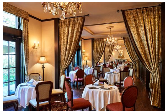
<Vaas ヴァース(レストラン)>