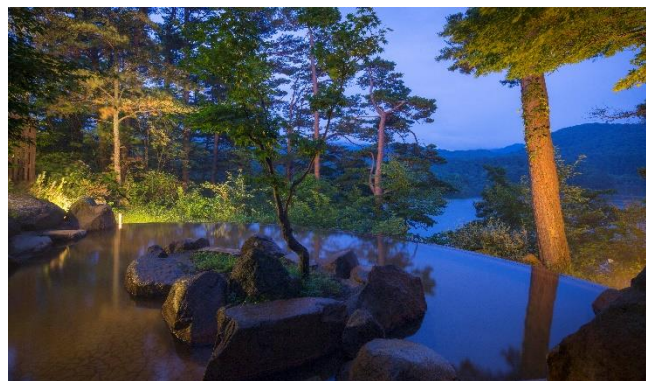
〈源泉掛流し「本館 ひばらみの湯」〉