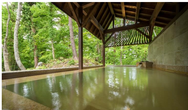
〈迎賓館猫魔離宮専用「虹の森温泉」〉