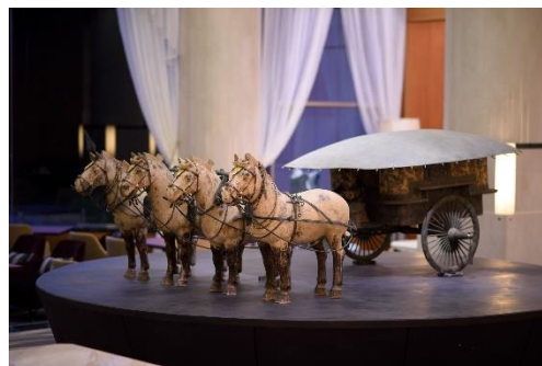
〈ホテルのシンボル「始皇帝金銀銅馬車」〉

裏磐梯レイクリゾート 迎賓館 猫魔離宮では、著名なアート、美術品の数々を展示しております。ロビーでは、国宝級の職人80名が3年の歳月を投じて完成させた「始皇帝金銀銅馬車」が圧倒的な存在感を放ちます。一流アーティストによる彫刻作品など、当ホテルでしか見ることのできないアートが、日常から切り離された大人のラグジュアリーステイを演出いたします。