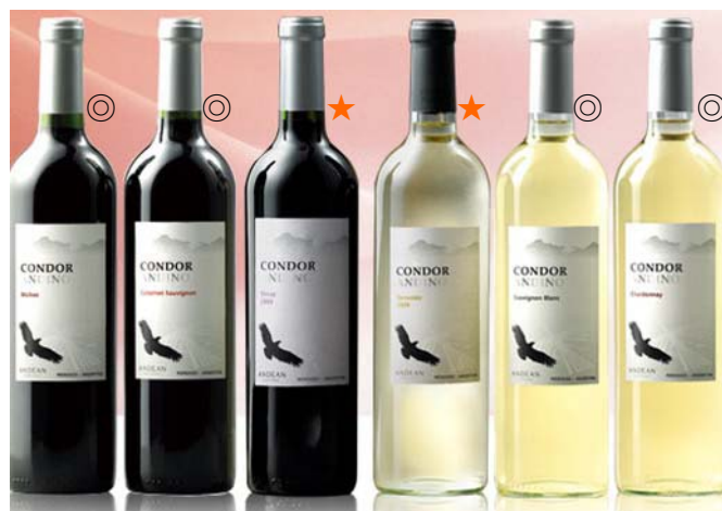
『コンドール・アンディーノ』全 6 種