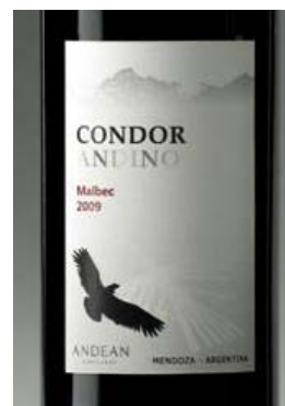
<コンドルをモチーフにしたラベル>

世界のワイン生産者上位 7 位に入る生産者グループに属する「アンデアン・ヴィンヤーズ」が醸造した、マイワインクラブの PB ワイン。アンデス山脈に生息するコンドルの姿をモチーフにした印象的なラベルで、アルゼンチンの大地で育ったぶどうの伸びやかな果実味が楽しめるというコンセプトを表現しています。