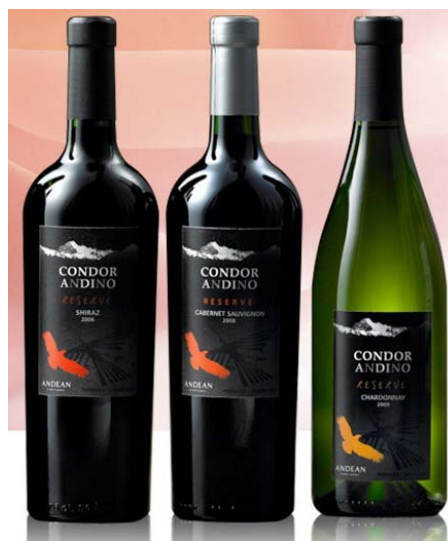
『コンドール・アンディーノ・レセルバ』

※3：セット販売価格から換算した1本あたりの参考価格です。1本での販売はしておりません。