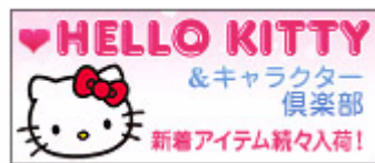
<ハローキティ&キャラクター倶楽部>