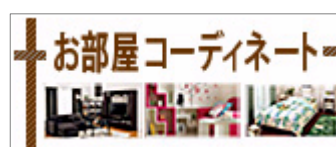
<お部屋コーディネート>

当社はカタログやインターネット等を通じて通信販売を展開しておりますが、中でもインターネット（モバイル含む）の売上は昨年対比 48.3%増 ※1 で推移する成長著しい販売チャネルです。ショッピングサイト「ベルーナネット」のお客様は20～60代以上と幅広いのが特長であり、それぞれの世代の趣味・嗜好やライフスタイルに合わせ、アパレル、インテリア商品、生活雑貨、を中心としたラインアップで約25,000点 ※2 をインターネットにて販売しています。