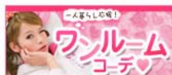
<一人暮らし応援！ワンルームコーデ>