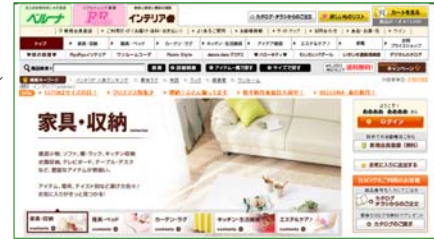
<インテリアサイト>