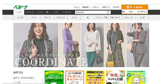
<ベルーナネット WEB サイト>