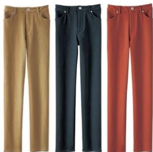
＜サンドベージュ、パープルグレー、テラコッタ＞