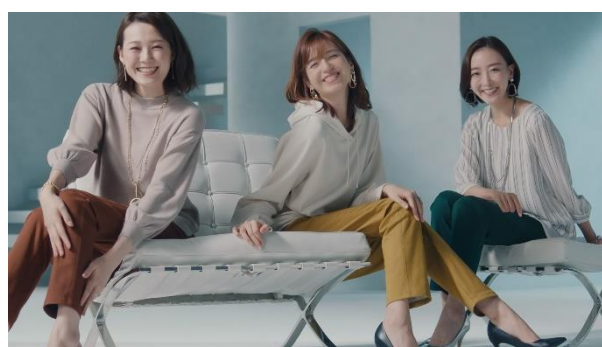
<あったか蓄熱保温！綿サテンストレッチパンツ> ¥1,990 ~ ¥2,990（税別）

昨年のTV-CM放送後に多くのご注文をいただいた「あったか蓄熱保温！綿サテンストレッチパンツ」。累計販売枚数20万枚を突破した（2020年6月時点）、一度はいたら手放せないはき心地抜群の一枚です。今年は新たなカラーとしてサンドベージュ、パープルグレー、テラコッタの3色も加わり、豊富な11色展開で販売しております（※カタログ、チラシ、WEB、店舗により販売色が一部異なります）。暖かい空気を保つ「蓄熱保温性素材」を使用しており、ふんわり裏起毛を施すことでより暖かさを追求しました。上品な光沢感のある綿サテンの生地とすっきりとした細身シルエットで、いつもの秋冬スタイルが旬顔に早変わり！ウエストもストレッチ仕様になっているため、長時間の在宅ワークでもラクなはき心地で快適にお過ごしいただけます。さらに、マシンウォッシュャブルでお手入れ簡単のため、着回しにもぴったりなこの冬大活躍のアイテムです。