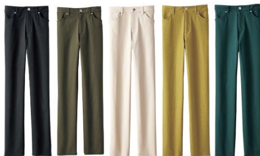
＜黒、モカ、オフ白、カラシ、モスグリーン＞