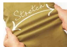
<裏起毛ストレッチ素材>

ベルーナでは、“お客様の衣食住遊を豊かにする商品やサービスの提供”という経営理念の下、お客様へより時代を捉えた多彩な商品やサービスを今後も提供し続けてまいります。