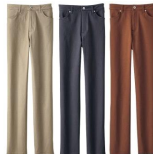
＜ベージュ、ネイビー、レンガ＞