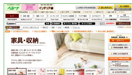
<インテリアサイト>