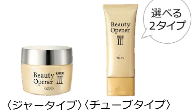
〈ジャータイプ〉〈チューブタイプ〉

赤ちゃんの肌に多く含まれる、Ⅲ型コラーゲンと深い関わりのある加水分解卵殻膜を中心に、プロテオグリカンやセラミド、プラセンタエキスなど肌悩みに効果を与える美容成分を配合し、* 大人の肌に簡単にハリや弾力を与えます。化粧水、美容液、保湿ジェル、乳液、化粧下地、うるおいパックの6つの役割を果たすオールインワンジェルです。合成着色料、鉱物油、パラベン不使用で、美容成分が角層まで気持ちよく浸透します。