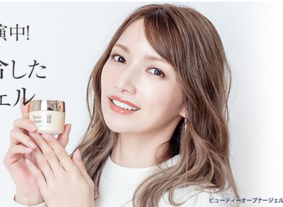
ビューティーオープナージェル