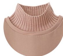
(左より) ブラック、ピンクベージュ、杳グレー