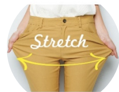
(左より) ブラック、ベージュ、ホワイト、モスグリーン、ラベンダー 抜群のストレッチ性