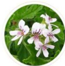
ニオイテンジクアオイ