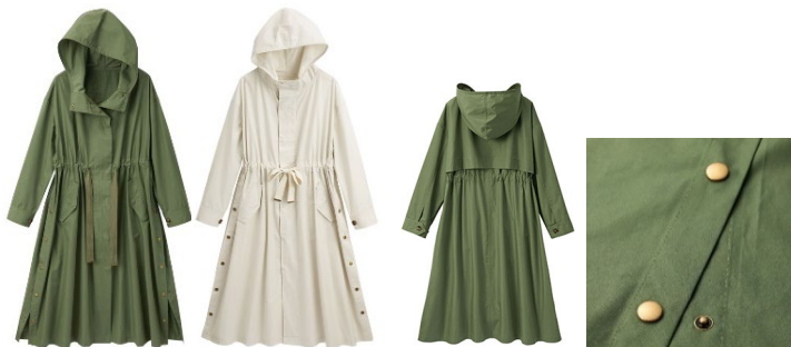
(左より) カーキ・アイボリー バックスタイル サイドスリット スナップボタン

■特長 : サラリと羽織れて便利な軽め素材のモッズコート。スナップボタンにより開閉可能な深めのスリットが今っぽく大人カジュアルな印象を与えます。ウエスト紐を調節し、気分に合わせてシルエットを変えられるのも魅力の一つ。キレイめワンピースと合わせてカジュアルダウンアイテムとしても着用できます。