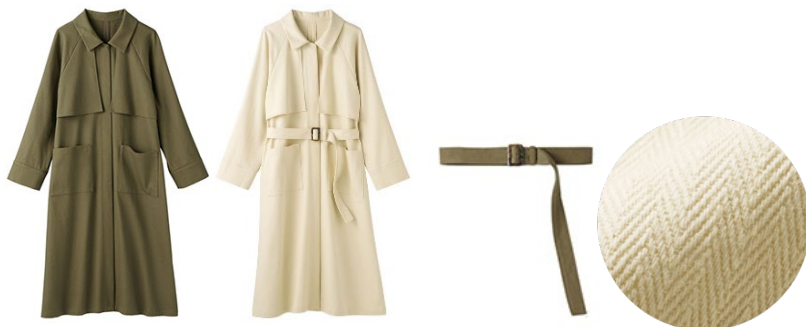
(左より) カーキ系・アイボリー系 共布ベルト付き 上品な質感の ヘリンボーン柄

■特長 : 厚みとハリ感のあるヘリンボーン生地がシックな、主役顔のステンカラーコート。旬のオーバーサイズシルエットと背中のだきめヨークデザインがトレンド感を演出してくれます。同素材ベルトでウエストマークすれば女性らしく上品に、ベルトを外せばカジュアルに、コーディネートに合わせた着こなしを楽しめます。