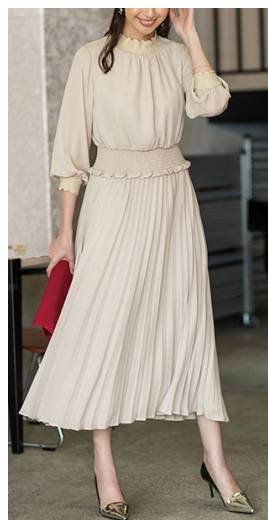
クラシカルワンピースセット2点スーツ