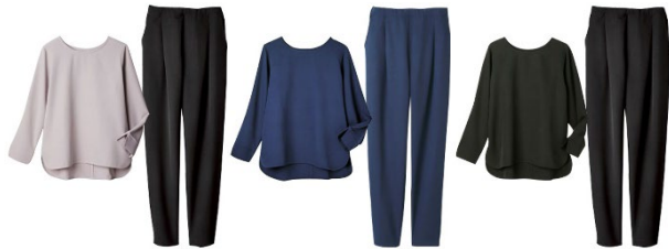
(左より) ライトグレー×ブラック・ネイビー・ブラック