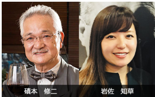
Wソムリエによる監修

マイワインクラブスタッフが仕入れたワインを、専属ソムリエが1本1本テイस्टング。お客様にご紹介するワインは、すべて専属ソムリエとスタッフによって厳選しています。