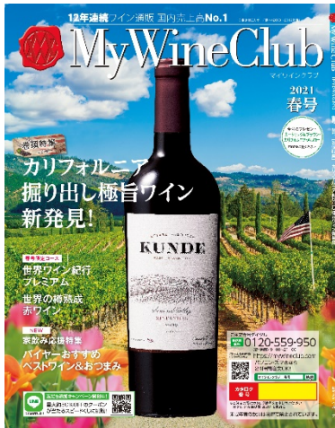
My Wine Club春号