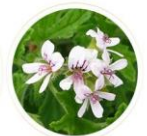
ニオイテンジクアオイ