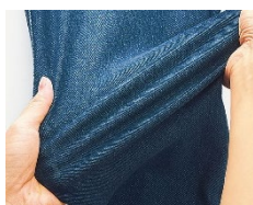
全方向ストレッチで 軽快なはき心地