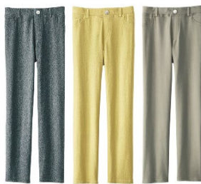
杳グレー・イエロー・オリーブ