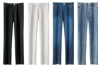
黒・オフ白・インディゴ・ケミカル