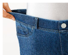
脱ぎはきラクラク 総ウエストゴム