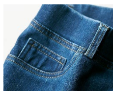
高見え本格デザインの ベルトループ・飾りポケット