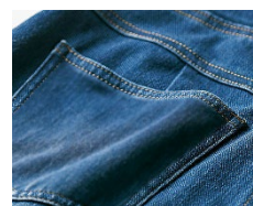
ヒップカバーも兼ねた 便利な後ろポケット