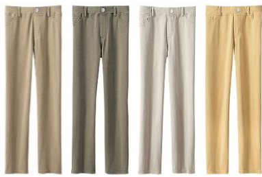
ベージュ・ライトモカ・ライトグレー・ソフトイエロー