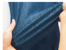
全方向ストレッチ

ベルーナでは、“お客様の衣食住遊を豊かにする商品やサービスの提供”という経営理念の下、お客様へより時代を捉えた多彩な商品やサービスを今後も提供し続けてまいります。