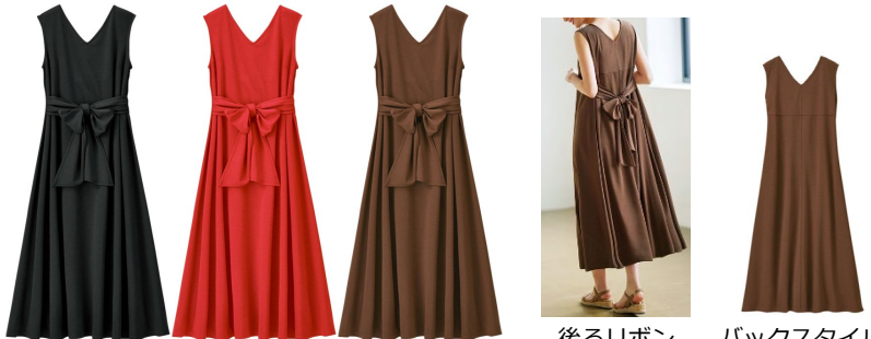
(左より) ブラック・レッド・ブラウン