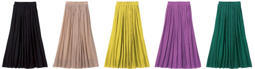
(左より) ブラック・ベージュ・イエロー・パープル・ブルーグリーン