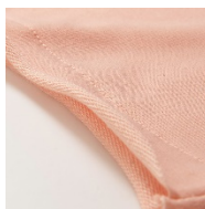
切りっぱなしデザイン