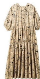
フロントボタン側