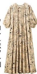
フロントギャザー側