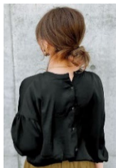
後ろボタンスタイル