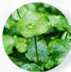
シカ(ツボクサ)葉エキス