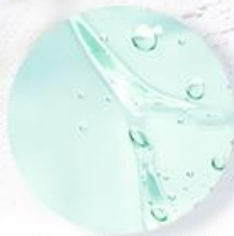
ヴィーガンコラーゲン*