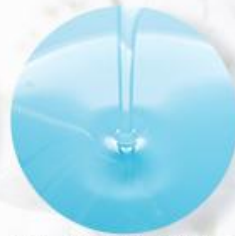
ヴィーガンヒアルロン酸**