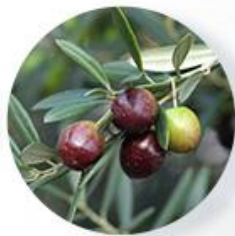
オリーブカルス培養溶解質