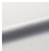
ひんやり身頃生地

ふんわりとしたマジョリカプリーツ使用の袖デザイン。ゆったりシルエットが気になるこの腕をカバーします。