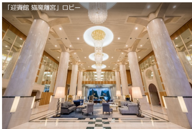
「迎賓館 猫魔離宮」ロビー

「裏磐梯レイクリゾート」は、国立公園内に位置しているリゾートホテルです。日本百名山のひとつである磐梯山を望み、眼下には桧原湖が広がる絶景が魅力。見るたびに様々な色彩を織り成すことで有名な五色沼までは徒歩3分と観光拠点としてもおすすめの好立地です。