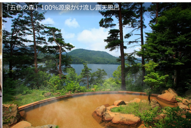
「五色の森」100%源泉かけ流し露天風呂

本館「五色の森」では、景色とあわせて身も心も癒す「100%源泉かけ流しの露天風呂」、「迎賓館 猫魔離宮」では迎賓館猫魔離宮専用露天風呂「虹の森温泉」をお楽しみいただけます。最新の設備からレトロな遊具まで揃う「バー付きプレイスポット」や美術品の展示など、館内を満喫していただける施設を完備しています。