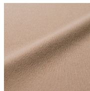
接触冷感機能つき素材

ストレッチが効いた伸縮性のある素材を使用。 ストレスフリーでラクなはき心地がかないます。