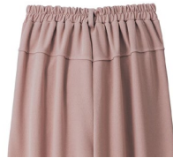
ウエスト後ろゴム