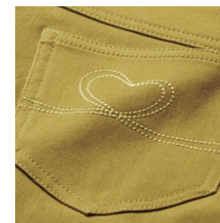
ステッチデザイン