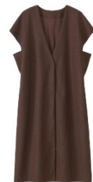
ボックスシルエット

ベルーナでは、“お客様の衣食住遊を豊かにする商品やサービスの提供”という経営理念の下、お客様へより時代を捉えた多彩な商品やサービスを今後も提供し続けてまいります。