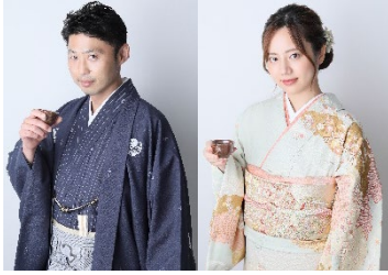
利酒師が選んだお酒を販売