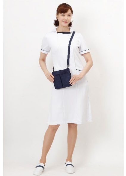
アクティブストレッチ・ネオ 配色パイピングワンピース