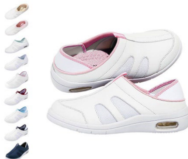
新定番2Wayデイリーエアーシューズ