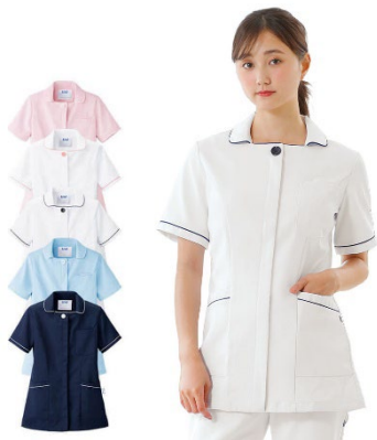
ブルンスタイル ジャケット (レディスBC2202)