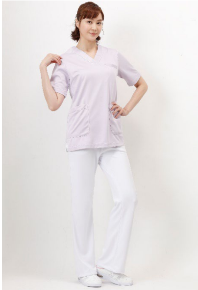
マルチジャケット