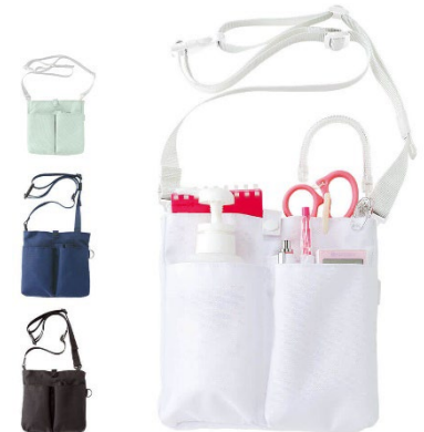
コンパクト2Wayオーガナイザー