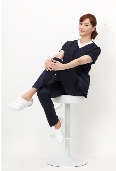
アメリカンクラブ