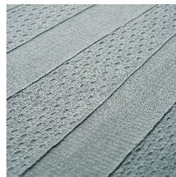
スカート部分生地