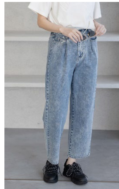
ケミカルウォッシュ