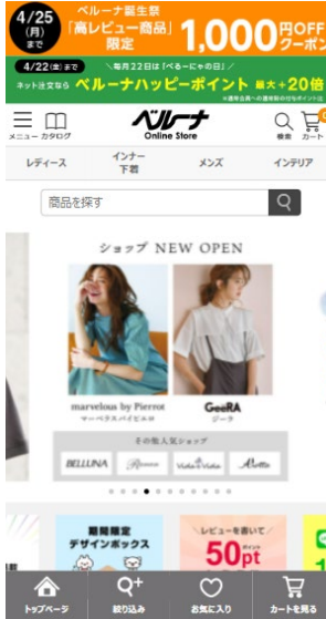
べるーなネット (PCサイト・スマートフォンサイト)