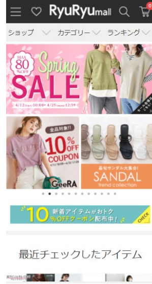
RyuRyumall (PCサイト・スマートフォンサイト)