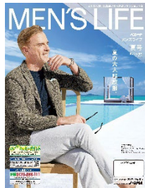
メンズライフ夏号