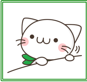
公式キャラクター「べるーにゃ」