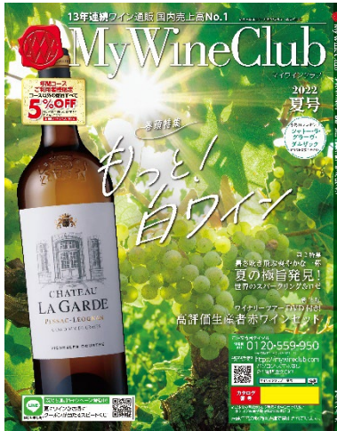
My Wine Club夏号