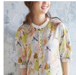
バンドカラーデザイン

ベルーナでは、“お客様の衣食住遊を豊かにする商品やサービスの提供”という経営理念の下、お客様へより時代を捉えた多彩な商品やサービスを今後も提供し続けてまいります。