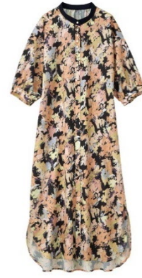
ネイビー系マルチ