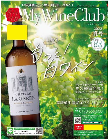
My Wine Club夏号