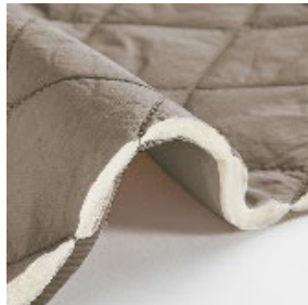
カポック混の中わた