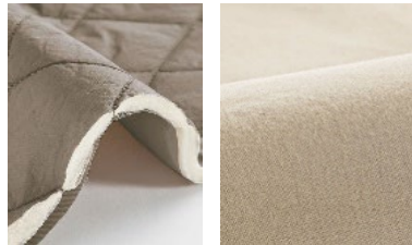
カボック混の中わた