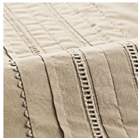
レース×ピンタック