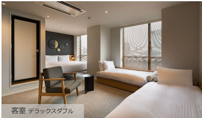
客室 デラックスダブル