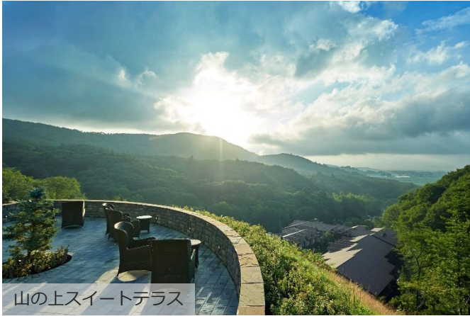
山の上スイートテラス