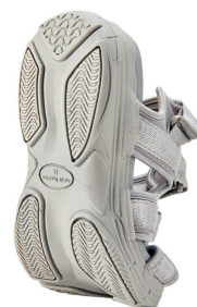
ソールの反り返り

ベルーナでは、“お客様の衣食住遊を豊かにする商品やサービスの提供”という経営理念の下、お客様へより時代を捉えた多彩な商品やサービスを今後も提供し続けてまいります。