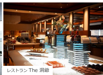
レストラン The 洞爺