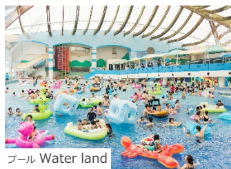
プール Water land