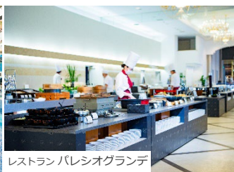
レストラン パレシオグランデ