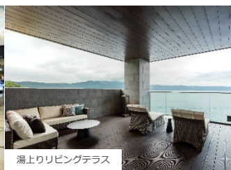
湯上りリビングテラス